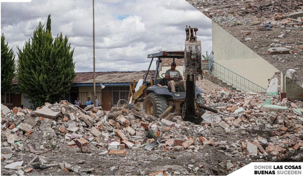
DONDE LAS COSAS BUENAS SUCEDEN